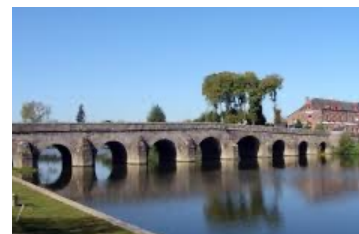
Le pont de Pont-Réan construit en 1767