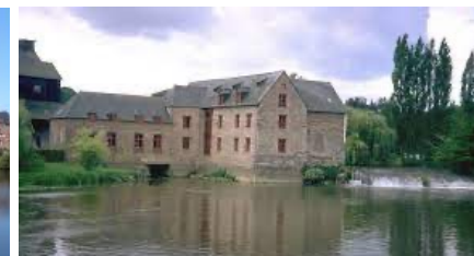
Moulin à blé dont l'origine remonte au Moyen Age, puis minoterie avec son déversoir à droite