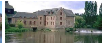
Moulin à blé, puis minoterie