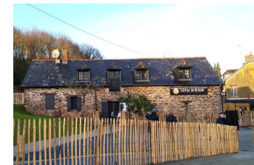
La Crêperie du Moulin