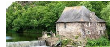
Le moulin du Boël