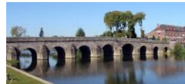
Le pont de Pont-Réan