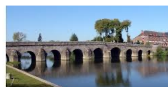
Le pont de Pont-Réan construit en 1767

7 Juste après le ponton, emprunter la glissière sous le petit pont, le toboggan à poisson. Effet émotion garanti !