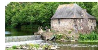
Le moulin du Boël construit en 1652