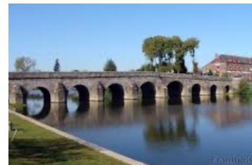
Le pont de Pont-Réan construit en 1767