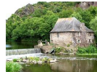
Le Moulin du Boël construit en 1652