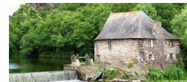
Le moulin du Boël