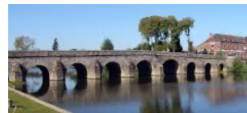
Le pont de Pont-Réan